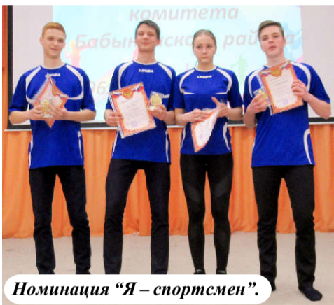
Номинация «Я – спортсмен».

Следующим было вручение знаков ГТО. Наш район занимает 2 место в рейтинге по сдаче норм ГТО среди муниципальных