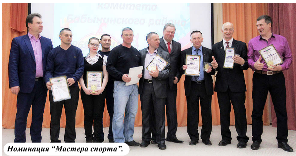
Номинация «Мастера спорта».

видео из спортивной жизни района разных лет. Сколько эмоций он вызвал в зале! Отличный получился подарок виновникам торжества.