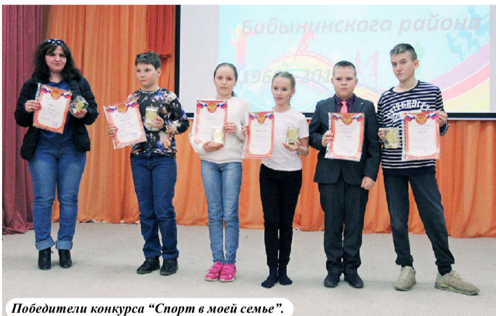
Победители конкурса «Спорт в моей семье».