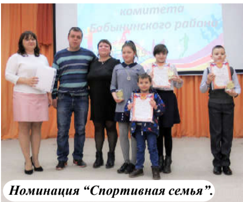
Номинация «Спортивная семья».

В заключение выступили воспитанники ДЮСШ. Сборная разновозрастная команда показала номер «Пирамида», в ходе которого ребята строились в различные скульптурные группы, как было очень модно в 70-80 годы прошлого века. Выступления встретили бурными аплодисментами, они показали отличный номер!