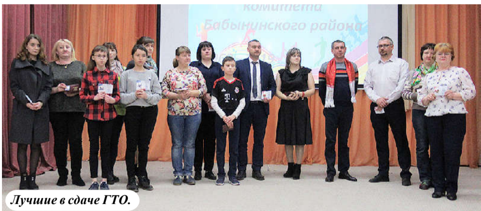
Лучшие в сдаче ГТО.

Он – мастер спорта СССР по легкой атлетике, факелоносец олимпийского огня в Калужской области, победитель Кубка Советского Союза в 1984 году в беге на 5000 м. Член союза журналистов России. В 2004 году награжден Дипломом Олимпийского комитета России и комитета флейпай за использование нравственных ценностей спорта в воспитании молодежи. Председа-