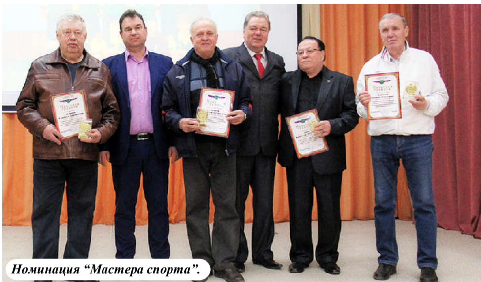
Номинация «Мастера спорта».

родного класса по прыжкам на лыжах с трамплина. В 2014 году принял участие в Сочинской Олимпиаде в качестве судьи.